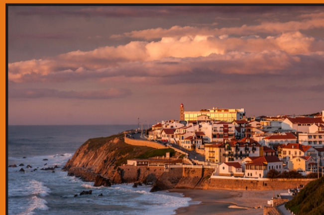
Sao Pedro de Moel

Después del desayuno salida hacia MIERES, visitando COIMBRA, ciudad universitaria. Almuerzo en ruta incluido.