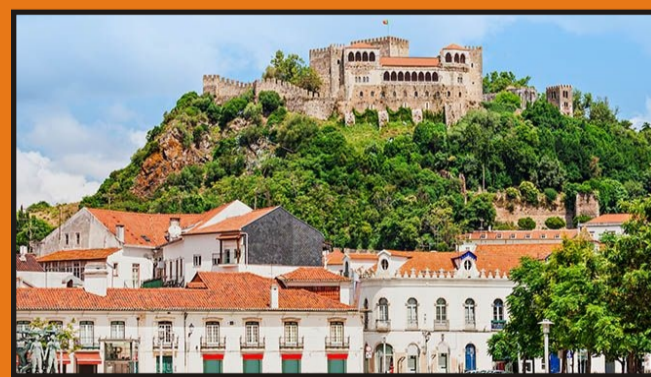
Castillo de Leiria

EL PRECIO INCLUYE: Autobús, guía acompañante, pensión completa tipo buffet, 3 almuerzos extras y seguro de viaje.