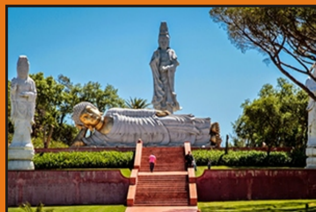
Jardín de Buddha Edem