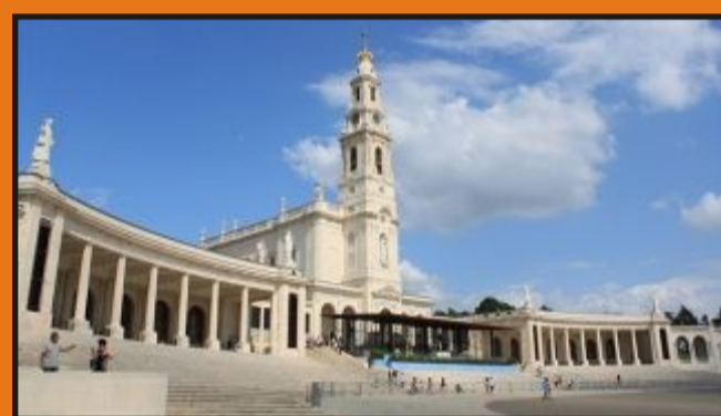
Santuario de Fátima